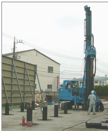
揚水処理設備の設置場所にて基礎の杭工事を開始しました。